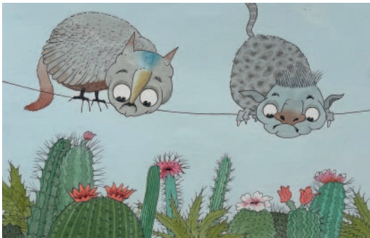
Die Angst der Seiltänzer